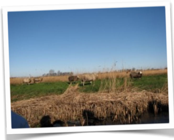
Het weer was prachtig!