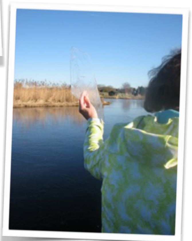
Het ijs was gelukkig net niet te dik!